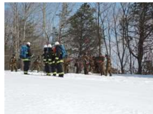
雪害による搜索訓練