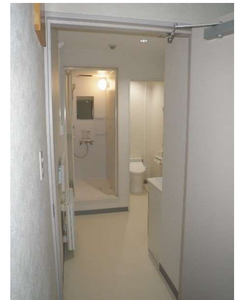
女性用シャワールーム