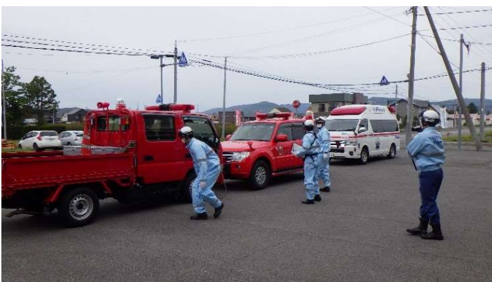
多数傷病者事案を想定した訓練