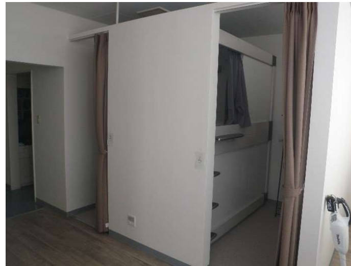
仮眠室（カプセル型ベッド）

また令和5年10月より女性専用の仮眠室やシャワールーム、感染対策に伴う仮眠室の個室化工事を行い、環境整備の充実を図りました。