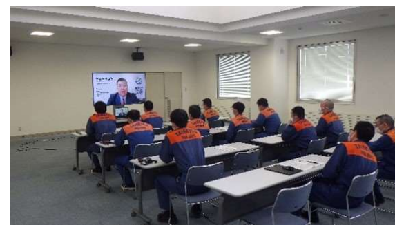
消防・救急職員研修