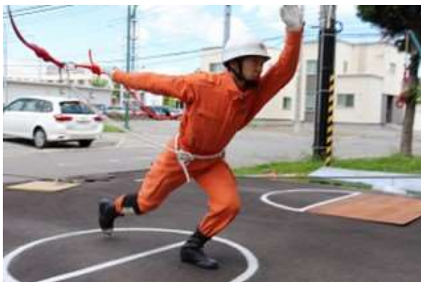
救助技術訓練指導会に向けた訓練

令和6年4月1日現在、職員数は28名で、毎日勤務・当直勤務し、火災・救急・救助等の各種災害に対応しています。また救急事後検証会や病院実習など救急活動に関する研修等も毎年実施され、さらにその他消防活動についても当直勤務時に各種訓練で技術・知識の向上に励んでいます。