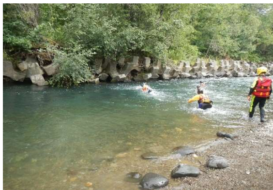
河川事故を想定した訓練